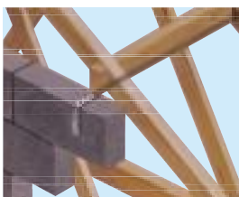
Kotwienie szczytu z konstrukcją dachu za pomocą taśmy M305