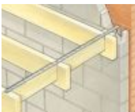
Taśma M305 mocowana do belek wzdłużnych. Uwaga: przerwy między belkami muszą być wypełnione drewnianymi przewiązkami.