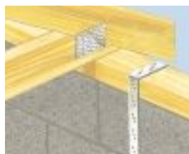
Taśma mocująca murlatę, przybita do muru i murlaty.