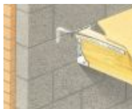
Taśma M305. 150 x 650 mm zgięta jednokrotnie i skręcona, przymocowana do prostopadłych belek. Uwaga: pionowy odcinek taśmy musi przylegać do muru.